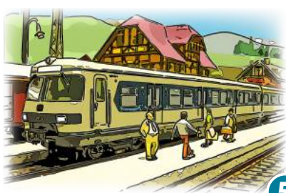
5 Fürther Miniaturwelten