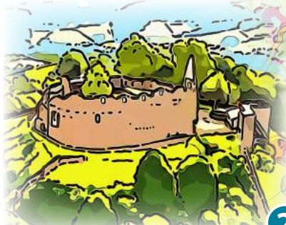
2 Burg Lindenfels