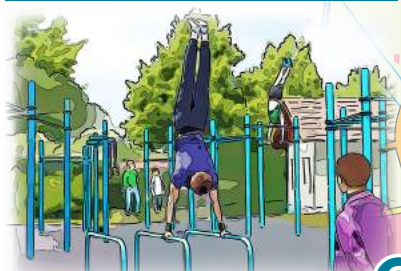
8 Street Workout Park