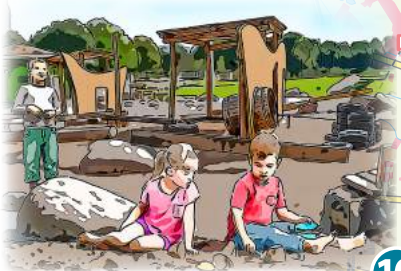
10 alla hopp! - Anlagen