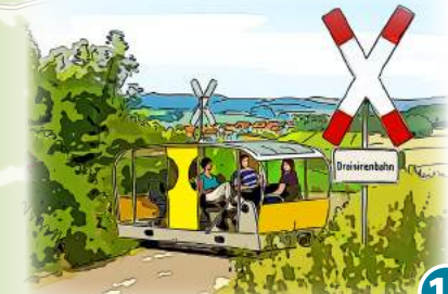
11 Solardraisine Überwaldbahn