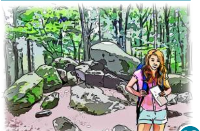
18 Kunst- und Panoramaweg