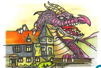
3 Deutsches Drachmuseum