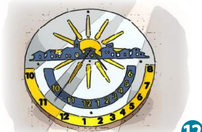
12 Dorf der Sonnenuhren