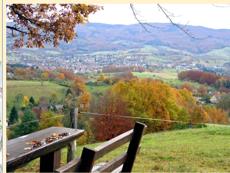
Rastplatz Hasselberg mit Rimbach/Tromm-Blick